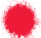
BERMELLÓN BRILLANTE A0352