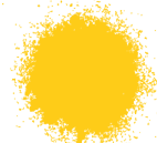
AMARILLO BRILLANTE A0356