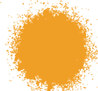
AMARILLO MEDIANO BRILLANTE A0355