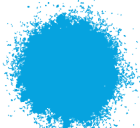
AZUL TRAFAL BRILLANTE A0368