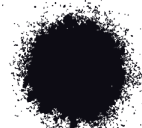
NEGRO BRILLANTE A0350 SATINADO A0450 MATE A0650