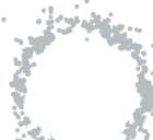
BLANCO BRILLANTE A0390 SATINADO A0490 MATE A0690