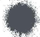
GRIS BRILLANTE A0364