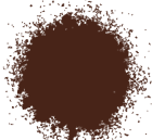
MARRÓN BRILLANTE A0353