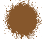
TOSTADO BRILLANTE A0365