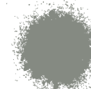
GRIS PERLA BRILLANTE A0366