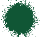
VERDE INGLÉS BRILLANTE A0360