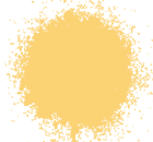
MARFIL BRILLANTE A0362