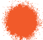
NARANJA BRILLANTE A0354