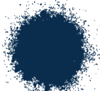
AZUL MARINO BRILLANTE A0367