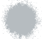
GRIS ESPACIAL BRILLANTE A0361