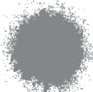
ALUMINIO BRILLANTE A0351